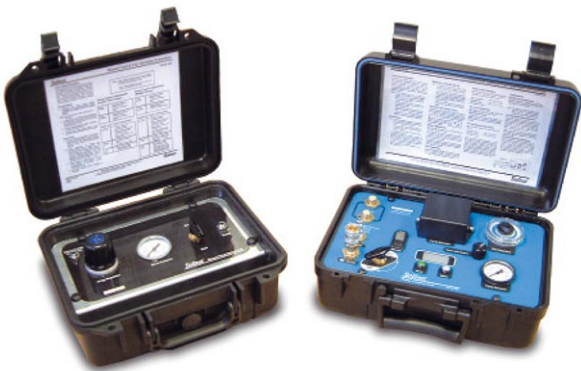
Manuaalinen säätöyksikkö 460

Elektroniset säätimet toimivat 8 AA-paristolla, mikä mahdollistaa 30 tunnin jatkuvan käytön. Näytteenotto on täysin automaattista ennalta asetettujen paine- ja huohotussykliin mukaan. Näitä on mahdollista säätää edelleen käsin virtauksen optimoimiseksi. Se mahdollistaa nopeamman puhdistuksen ja tarkan hidasvirtauksen, jolloin voidaan varmistaa edustava näytteenotto nopeudella 100 ml/min tai vieläkin pienemmällä nopeudella kun kyseessä on haihtuvien orgaanisten yhdisteiden (VOC) näytteenotto. Vakiomalli 466 antaa 160 psi:tä ja 466HP antaa 250 psi:tä.