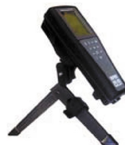
063507 kolmijalka, ihanteellinen laboratorioon