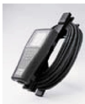
603062 kaapelin pidin