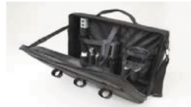
603075 pehmeä kuljetuskotelo, johon mahtuvat Pro 20, kaapeli ja tarvikkeet