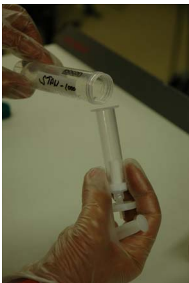
Kaada uuttoputkilosta ruiskuun