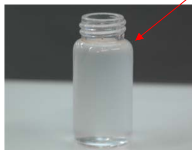
täytä kierteen alaosaan asti