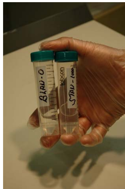
ja ravista 10 sekuntia