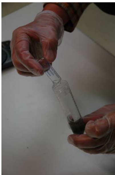
ja kaada ne uuttoputkiin